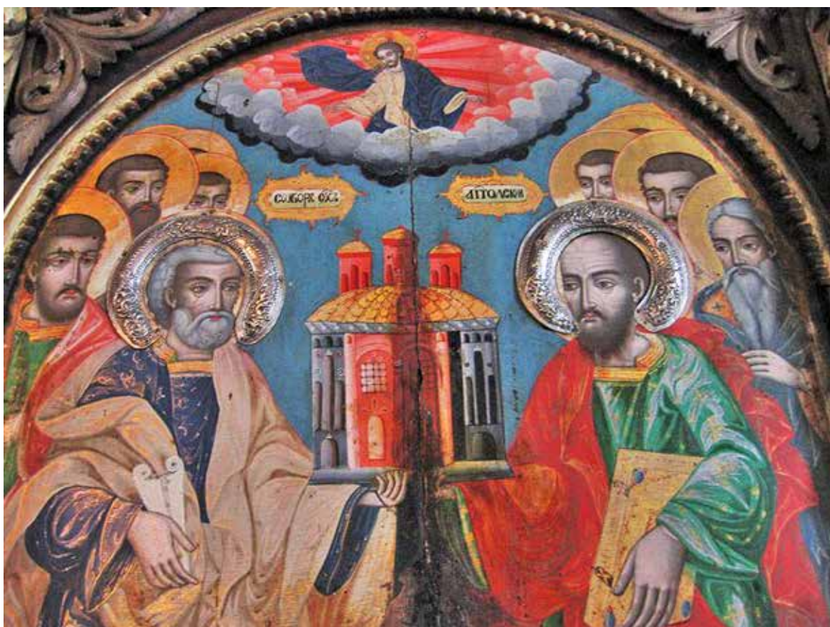
10. Апостолски събор, икона от царския ред на иконостаса в Пазарската църква в Пирот. Йоан Попниколов

налице нов запис от 779 гроша, платени „на майстор йована изографа“ 40 . Този запис се свързва в литературата с плащане към Йоан иконописец от Самоков 41 , но това изобщо не е уточнено в самия извор. Затова остава възможно и той да е свързан със заплащане към габровския зограф, тъй като очевидно Йоан е изработил поне още една царска икона и вероятно повече от една празнични икони, въпреки, че те не са ни познати към този момент. Ако приемем, че тези сведения се отнасят до работата на Йоан от Габрово, то тогава той ще е изработил своите произведения вероятно през 1849 г., за да може да получи заплащането си за тях през 1849–1850 г. За съжаление, това предположение не може да бъде потвърдено чрез втори извор, но се вписва сред малкото датирани произведения на зографа без да им противоречи.