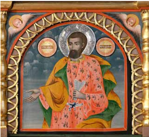
6. Ап. Вартоломей, икона от Пазарската църква в Пирот. Йоан Попниколов