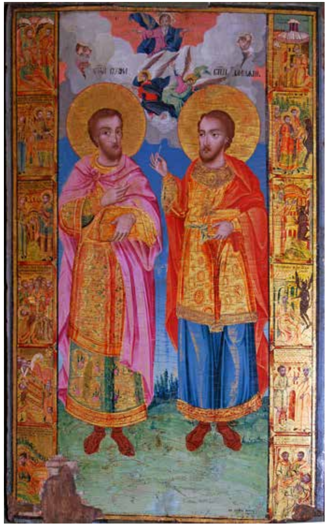
3. Св. св. Козма и Дамян, икона от Дряново, днес в СМРЗИ – Трявна, Йоан Попниколов

зографа, които се намират в Пирот и Станичене 19 и могат да му се припишат по стилови белези. (ил. 4, 5)