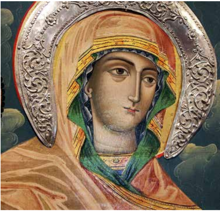
4. Св. Богородица, детайл от апостолския ред на иконостаса в Пазарската църква, Пирот. Йоан Попниколов