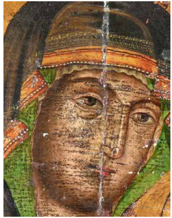
5. Св. Богородица, детайл от икона от Лясковския манастир, Йоан Попниколов (сн. Иван Ванев)

торски надпис не се разчита изцяло, поради което остава неясно от кой еснаф е дарена тя. (ил. 9) Отново негова е и иконата Апостолски събор от царския ред. (ил. 10) Нито една от иконите не е подписана или датирана, а единичните икони от празничния и царския ред на иконостаса създават сериозно затруднение в изясняването на датиранието на тези произведения и вида на поръчката, която е била отправена към габровския майстор.